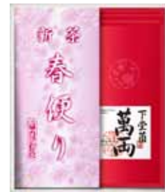
春便り・萬両セット

●新茶まつり&母の日 4/21(月)～5/11(日) 期間限定 春便りセット 全国送料一律 ¥ 400