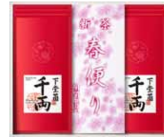
春便り・千両セット

人気の「千両」2袋入りのお得なセット。この時期限定の「春便り」を添えて、春を満喫。 ●「春便りホワイト」80g 袋入り、「千両」100g 袋入り×2